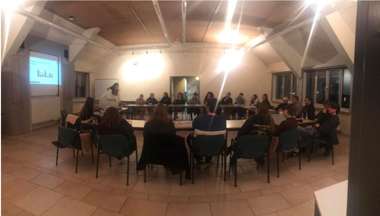
Bevraging AV door kernbestuur