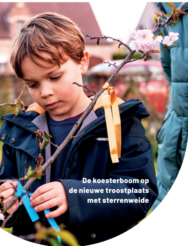
De koesterboom op de nieuwe troostplaats met sterrenweide