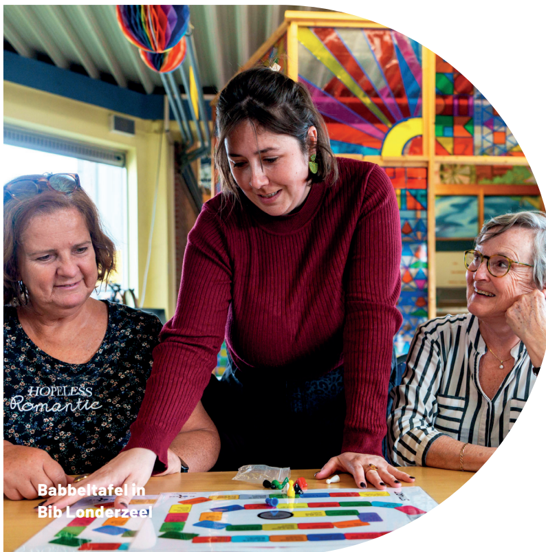
Babbeltafel in Bib Londerzeel