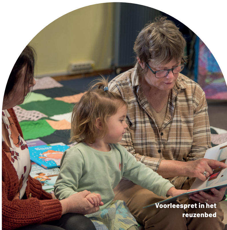
Voorleespret in het reuzenbed