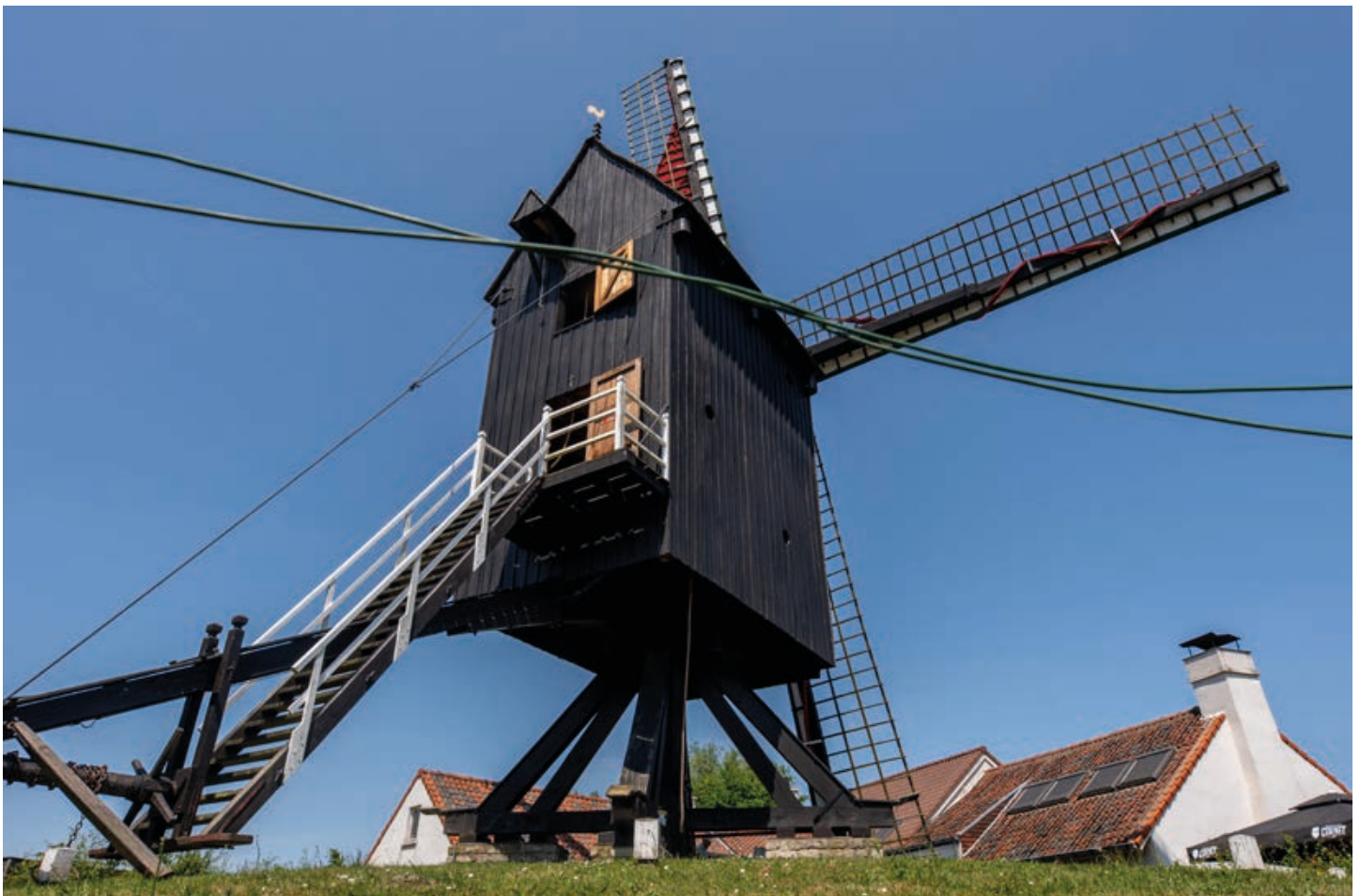
De Heidemolen in Malderen

Wellicht staat al sinds de 15 de eeuw op deze plek – op de vroegere heide in Malderen - een molen. De Heidemolen zou daarmee een van de oudste staakmolens van Vlaanderen zijn.