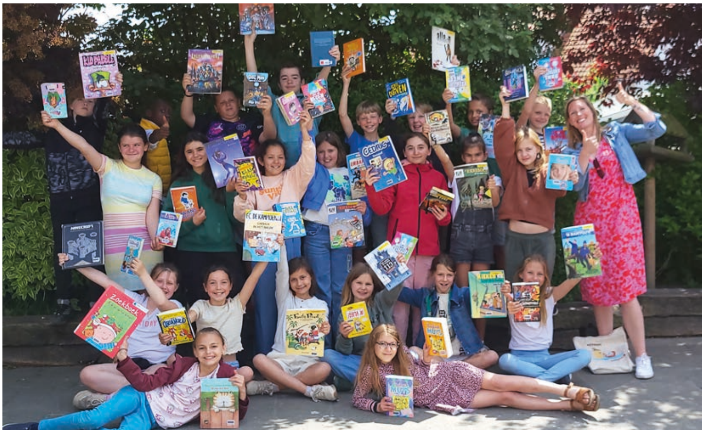
Klas 5B van de Centrumschool

De geselecteerde foto's worden vergroot en geplaatst langs het traject vanaf de Dag van de Trage Wegen tot woensdag 15 november 2023. Een unieke kans dus om elke wandelaar van jouw foto te laten genieten!