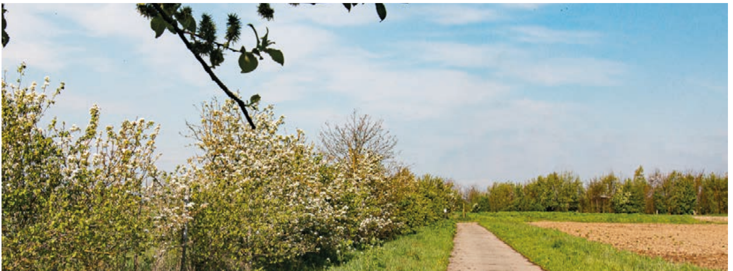
Heerlijk wandelen of fietsen langs trage wegen

Bron herkomst benaming trage wegen: Geschied- en Heemkundige Kring Londerzeel (GHKLonderzeel)