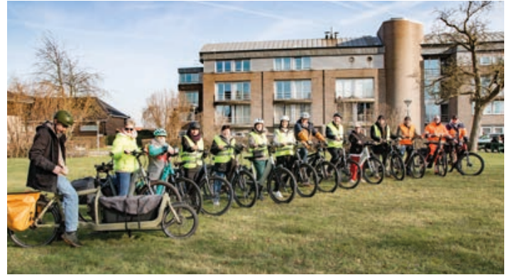
medewerkers Gemeente Londerzeel op hun nieuwe fiets

Tot slot ondersteunen we de lokale fietshandelaars door medewerkers de mogelijkheid te bieden om bij hun vertrouwde fietshandelaar een leasefiets te kopen. Onderhoud en eventuele herstellingen kunnen dan vlot en dicht bij huis gebeuren.