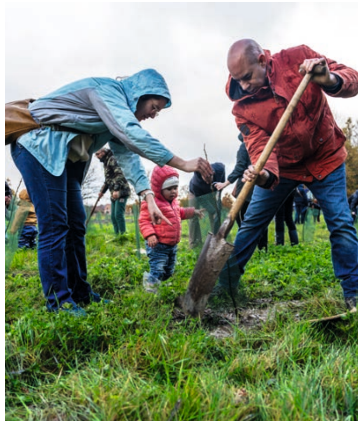
Ouders en kindjes zijn druk in de weer met het planten van hun geboorteboom

Op zaterdag 25 november werden 55 geboortebomen toegevoegd aan het geboortebos in de A. Lambertstraat. We begroetten 54 kindjes en stonden stil bij de herinnering aan één sterrenkindje. Alle ouders van kinderen geboren in 2022 werden uitgenodigd om een boom te planten. We kozen voor winterlindes. Een mooi symbool voor de toekomst van de kinderen en een bijdrage tot het vergroenen van onze gemeente.