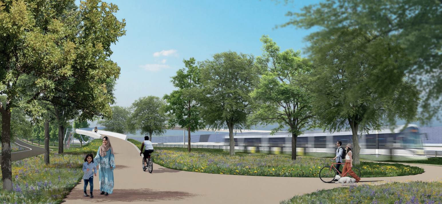
fietsbrug Plantentuin Meise