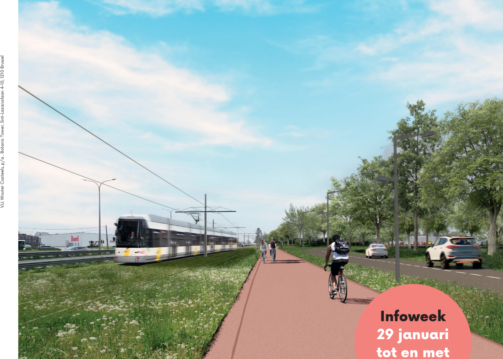
VLL Werken aan de Ring, v.o. Betancourt Tower, Sint-Lazaruslaan 4-10, 1210 Brussel

Bedrijfsleider, eigen zaak, verantwoordelijke in een sportzaal of bijvoorbeeld een ziekenhuis? Schrijf je dan zeker in via werkenaantering.be/agenda